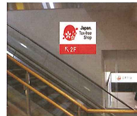
階段誘導サインイメージ図